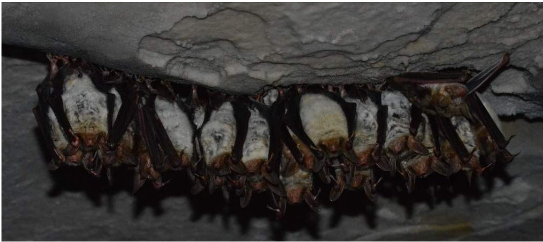
Grands murins hibernant dans un site récemment acquis

A la fin de 2017, la superficie des terrains acquis par votre conservatoire depuis sa création atteint