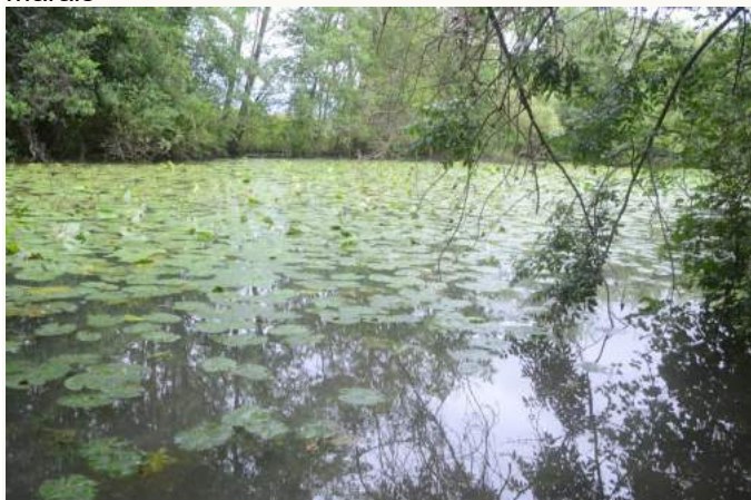
en Bassée, la noue de Neuvry, à Bray sur Seine

dans la Bassée, à Bray sur Seine (77) 2 ha 17 en bordure d'une petite rivière, comme l'illustre la photo précédente d'un belle touffe de Caltha palustris , une grosse renoncule connue sous le nom de Populage des marais